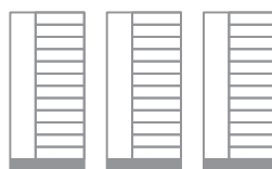
32 x LITE 90